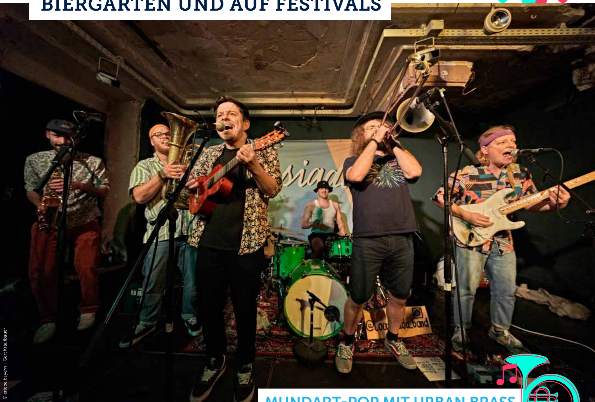
MUNDART-POP MIT URBAN BRASS INDIE BAND LOAMSIADA